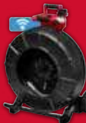
Cámara de 60m, espiral de 34mm