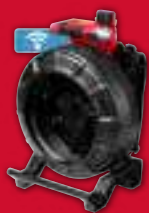
Cámara de 36m, espiral de 25mm