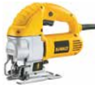
Sierra Caladora Orbital de Velocidad Variable

Acción pendular de 4 posiciones / Innovador sistema de cuchilla al filo para cortes exactos / Mecanismo de contrapeso que reduce la vibración.