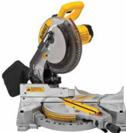
Sierra Ingleteadora 10\"/>

Capacidad de inglete izquierda y derecha 0°-52° / Ángulos de bisel de 3° a 48° / Escala de ingletes ajustables en acero inoxidable con 11 paradas prefijadas.