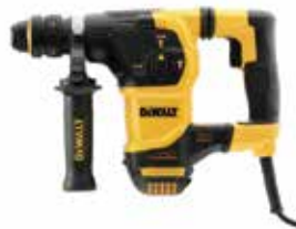
Rotomartillo SDS Plus 1-1/4" BRUSHLESS con Broquero de 1/2" de Acople Rápido

Embrague de Seguridad en caso de que la broca se atasque / Plataforma Perform & Protect, reduce al máximo la vibración / Diseño compacto, ligero y ergonómico.