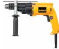
Rotomartillo 1/2" Doble VVR

Velocidad variable y reversible / Empuñadura de goma para más comodidad / Mango lateral de 360 grados con varilla de profundidad.