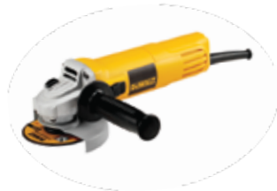
Esmeriladora Angular 4 1/2" Velocidad Variable

Sistema de ventilación avanzado que prolonga la vida del motor / Interruptor deslizable / Bloqueo del eje para cambios rápidos del disco