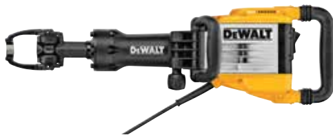
Martillo Demoledor 1-1/8" Hexagonal 16 kg

Sistema de control de vibración de contrapeso / Módulo de control progresivo y mantenimiento de la potencia continua bajo carga / Mecanismo electro-neumático de alta capacidad de presión.