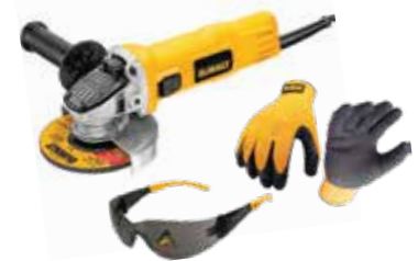
Esmeriladora Angular 4 1/2" + Guantes + Gafas

Motor protegido contra la abrasión / Pieza de ajuste de carbones, mantiene en contacto con el motor en todas las condiciones / Caja de engranajes reducida.