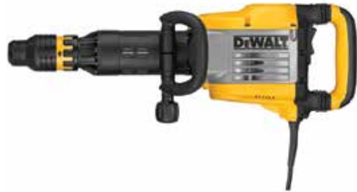
Martillo Cincelador SDS MAX 12 kg

Tecnología SHOCKS® de control de vibración / Control de impacto variable / Empuñadura trasera flotante recubierta de goma.