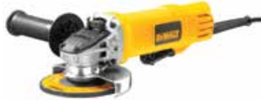
Esmeriladora Angular 4 1/2"

Circunferencia de agarre pequeña: 194 mm / Carbones más grandes (mayor vida útil) / Caja de engranes tipo JAMPOT que reduce ruido y vibración.