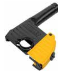
Guarda extractora de polvo 5" / 6"

Rotor y estátor cubiertos con resina epóxica para evitar abrasión / Carbones de conexión automática / Motor diseñado para rápida eliminación de material y protección de sobrecarga.