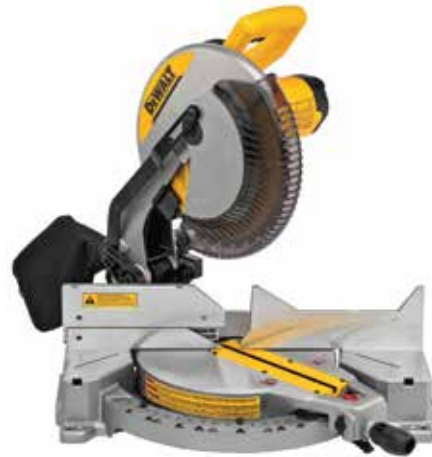
Sierra Ingleteadora 12\"/>

Escalas de ángulos de bisel e inglete grabadas sobre placas independientes / Guía posterior alta y ajustable / Corte transversal: 346mm: mayor capacidad en su clase.