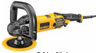
Pulidora/Lijadora Angular 7" y 9"

Velocidad variable / Sistema de Acabado Controlado SAC con arranque suave, controla electrónicamente la velocidad bajo carga / Filtros contra la absorción de residuos de lana en las entradas de aire.