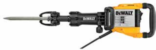
Martillo Demoledor 1-1/8" Hexagonal 16 kg

Sistema de control de vibración de contrapeso / Módulo de control progresivo y mantenimiento de la potencia continua bajo carga / Mecanismo electro-neumático de alta capacidad de presión.