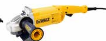
Esmeriladora Angular 7"

Bloqueo de eje para cambiar discos fácil y rápidamente / Ventana de acceso directo a los carbones para mayor comodidad / Mango lateral con 2 posiciones para ajustarse a cualquier situación.