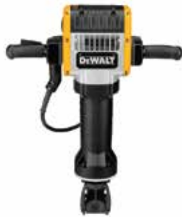
Rompe Pavimentos 30kg Encastre 28mm Hexagonal

Control Activo de Vibración AVC / Módulo electrónico de arranque progresivo para mayor control y potencia constante / 3 sistemas antivibración: Sistema SHOCK® / Sistema de mango suspendido / Mangos recubiertos de goma.