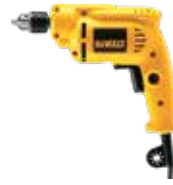
Taladro 1/4" VVR

Engranajes helicoidales con tratamiento térmico / Broquero auto-ajustable con traba de eje / Gatillo de goma para dos dedos da mayor comodidad.