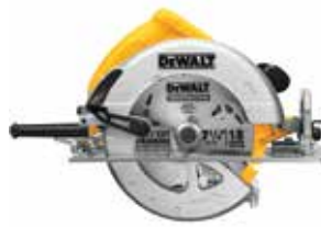
Sierra Circular 7-1/4"

Cuenta con Soplador y Cable Ajustable a 2 Posiciones / Guarda super-resistente de 3 mm de espesor / Diseño de guarda con pestaña que permite cortes en todos los ángulos sin atascarse.