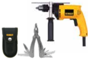
Rotomartillo 1/2" VVR + Multiherramienta

Construido 100% con rodamientos de bolas y rodillos para mayor vida / Diseño contorneado y ergonómico.