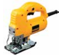
Sierra Caladora Orbital de Velocidad Variable

Selector de velocidad de 7 posiciones para mayor control / Ajuste de bisel sin herramientas permite cortes en ángulo / Luz LED para mayor iluminación.