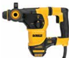
Rotomartillo SDS Plus 1-1/4" BRUSHLESS

Embrague de Seguridad en caso de que la broca se atasque / Plataforma Perform & Protect, reduce al máximo la vibración / Diseño compacto, ligero y ergonómico.