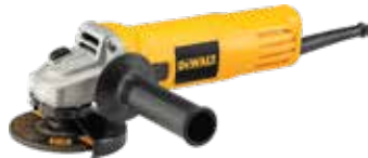
Esmeriladora Angular 4½"

Sistema de ventilación que proporciona flujo de aire máximo / Bloqueo de eje para cambios rápidos de discos / Compacta caja de engranajes que permite su uso en espacios reducidos.