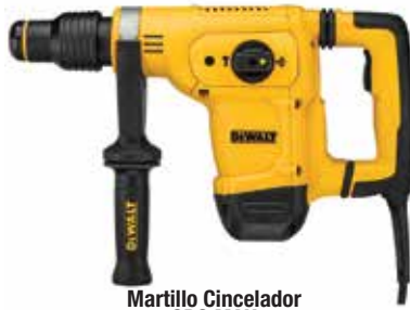
Martillo Cincelador SDS MAX

Tecnología SHOCKS® de control de vibración / Velocidad electrónica constante permite mantener la velocidad bajo carga / Mecanismo y sistema de motor optimizados para trabajo rápido de cincelado.