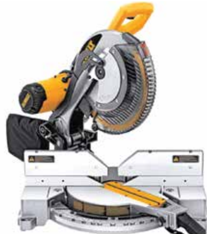
Sierra Ingleteadora 10\"/>

Capacidad de inglete izquierda y derecha 0°-52° / Ángulos de bisel de 3° a 48° / Escala de ingletes ajustables en acero inoxidable con 11 paradas prefijadas.