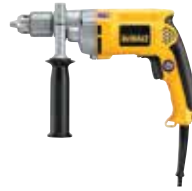
Taladro 1/2" VVR

Diseño liviano para menor fatiga del usuario / Gatillo de goma de dos dedos para mayor comodidad.