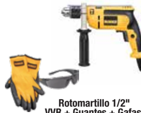
Rotomartillo 1/2" VVR + Guantes + Gafas

Construido 100% con rodamientos de bolas y rodillos para mayor vida / Diseño contorneado y ergonómico.