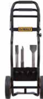
Diablito transportador Demoledor D25980-B3

Control Activo de Vibración AVC / Módulo electrónico de arranque progresivo para mayor control y potencia constante / 3 sistemas antivibración: Sistema SHOCK® / Sistema de mango suspendido / Mangos recubiertos de goma.