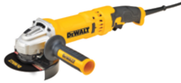
Esmeriladora Angular 4 1/2" Quick Change

Motor Brushless / Función de liberación sin voltaje en caso de corte de energía / Embrague y freno de retroceso electrónicos.