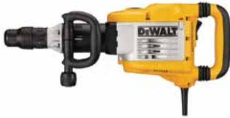
Martillo Demoledor SDS MAX 10 kg

Tecnología SHOCKS® de control de vibración / Control de impacto variable / Empuñadura trasera flotante recubierta de goma.