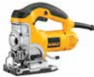
Sierra Caladora Orbital de Velocidad Variable

Acción pendular de 4 posiciones / Innovador sistema de cuchilla al filo para cortes exactos / Mecanismo de contrapeso que reduce la vibración.