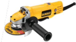
Esmeriladora Angular 4 1/2" + 3 Discos de Diamante

Rotor y estátor cubiertos con resina epóxica para evitar abrasión / Carbones de conexión automática / Motor diseñado para rápida eliminación de material y protección de sobrecarga.