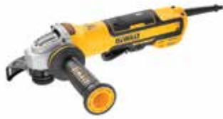
Esmeriladora Angular 4 1/2" Uso Extra Pesado BRUSHLESS

Motor Brushless / Función de liberación sin voltaje en caso de corte de energía / Embrague y freno de retroceso electrónicos.