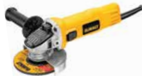
Esmeriladora Angular 4 1/2"

Sistema de ventilación avanzado que prolonga la vida del motor / Interruptor deslizable / Bloqueo del eje para cambios rápidos del disco