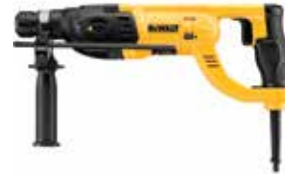
Rotomartillo SDS Plus 1"

Embrague de Seguridad en caso de que la broca se atasque / Mango de agarre tipo pistola / Velocidad Variable y Reversible.