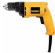
Taladro 3/8" VVR

Engranajes helicoidales con tratamiento térmico / Broquero auto-ajustable con traba de eje / Gatillo de goma para dos dedos da mayor comodidad.