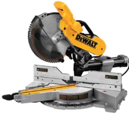
Sierra Ingleteadora 12\"/>

Escalas de ángulos de bisel e inglete grabadas sobre placas independientes / Guía posterior alta y ajustable / Corte transversal: 346mm: mayor capacidad en su clase.