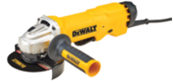
Esmeriladora Angular 4 1/2" Industrial

Circunferencia de agarre pequeña: 194 mm / Traba de uso continuo / Embrague electrónico.