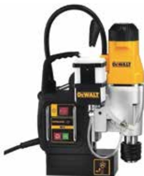
Taladro Magnético 2" Encastre Weldon 19mm

Panel de control intuitivo - encendido / apagado del magneto y controles del taladro con indicador de LED.