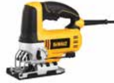
Sierra Caladora Orbital de Velocidad Variable

Sistema de cambio rápido de segueta / Acción orbital de 4 posiciones / Zapata biselada de 0 a 45 grados en ambas direcciones.