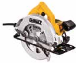
Sierra Circular 7-1/4"

Cuenta con Soplador y Cable Ajustable a 2 Posiciones / Guarda super-resistente de 3 mm de espesor / Diseño de guarda con pestaña que permite cortes en todos los ángulos sin atascarse.