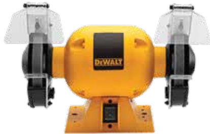
Esmeril de Banco de 6"

Motor de inducción de 1/2 HP para esmerilados industriales / Base y motor de hierro fundido / Soportes de aluminio maquinados a precisión.