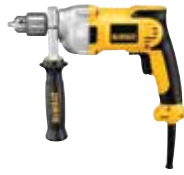
Taladro 1/2" VVR

Diseño liviano para menor fatiga del usuario / Gatillo de goma de dos dedos para mayor comodidad.