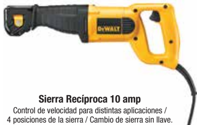
Sierra Reciproca 10 amp

Control de velocidad para distintas aplicaciones / 4 posiciones de la sierra / Cambio de sierra sin llave.