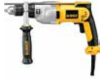
Rotomartillo 1/2" VVR

Velocidad variable y reversible / Empuñadura de goma para más comodidad / Mango lateral de 360 grados con varilla de profundidad.