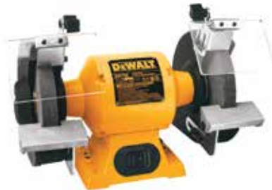
Esmeril de Banco de 8"

Motor de inducción de 3/4 HP para esmerilados industriales / Base y motor de hierro fundido / Soportes de aluminio maquinados a precisión.