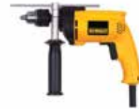
Rotomartillo 1/2" VVR

Doble rango de velocidad variable y reversible / Doble modo: taladro (madera y metal) y rotomartillo (concreto y mampostería) / Protección contra sobre carga.