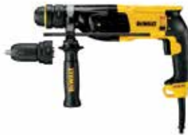
Rotomartillo SDS Plus 1" con Broquero de 1/2"

Ideal para trabajos en hormigón o mampostería desde 4 a 26mm de diámetro / Embrague de seguridad en caso de que la broca se atasque / Velocidad Variable y Reversible.