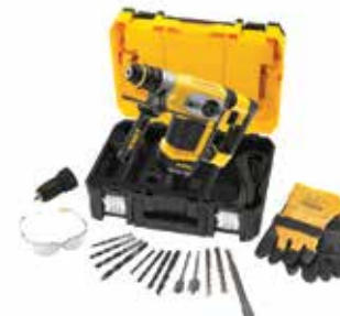
Rotomartillo SDS Plus 1-1/4" con Accesorios

Embrague de Seguridad en caso de que la broca se atasque / Plataforma Perform & Protect, reduce al máximo la vibración / Diseño compacto, ligero y ergonómico.