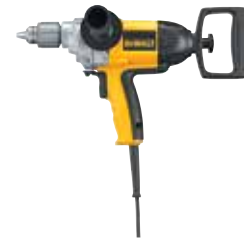
Taladro Tipo Espada 1/2" VVR

Mando contorneado y texturizado / Diseño ergonómico y compacto / Carcasa de nylon con fibra de vidrio resistente al impacto.