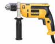
Rotomartillo 1/2" VVR

Compacto y ligero para una mayor comodidad / Interruptor electrónico sellado contra el polvo / Diseño de la carcasa tipo Jampot contorneado y ergonómica.