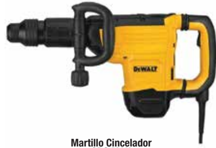
Martillo Cincelador SDS MAX

Tecnología SHOCKS® de control de vibración / Velocidad electrónica constante permite mantener la velocidad bajo carga / Mecanismo y sistema de motor optimizados para trabajo rápido de cincelado.