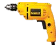
Rotomartillo 3/8" VVR

Diseño liviano para menor fatiga del usuario / Gatillo de goma de dos dedos para mayor comodidad.