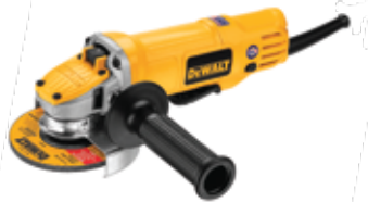
Esmeriladora Angular 4½" 220 V

Sistema de ventilación que proporciona flujo de aire máximo / Bloqueo de eje para cambios rápidos de discos / Compacta caja de engranajes que permite su uso en espacios reducidos.