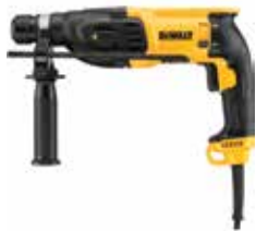
Rotomartillo SDS Plus 1"

Ideal para trabajos en hormigón o mampostería desde 4 a 26mm de diámetro / Embrague de seguridad en caso de que la broca se atasque / Velocidad Variable y Reversible.