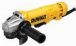
Esmeriladora Angular 4 1/2" Uso Rudo

Circunferencia de agarre pequeña: 194 mm / Carbones más grandes (mayor vida útil) / Caja de engranes tipo JAMPOT que reduce ruido y vibración.