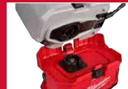
Juntas reemplazables para eliminar restos de contaminación entre productos químicos