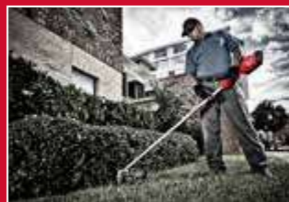
Potencia suficiente para cortar matorral denso