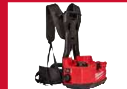
Correas anchas para una mayor comodidad para largos períodos de uso