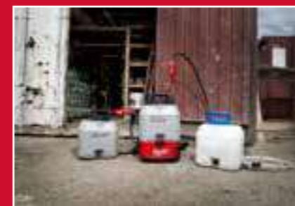
Diseño de tanque intercambiable