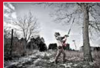
Diseñado para cumplir con las necesidades del usuario