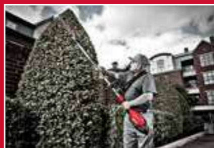
Perfecto para cortar ramas